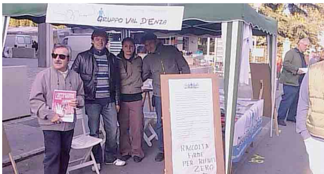
Il banchetto del Gruppo Val d'Enza Amici di Beppe Grillo al mercato di Sant'Ilario

Il Gruppo Val d'Enza degli Amici di Beppe Grillo, presente durante il mercato settimanale a Sant'Ilario, ha proseguito la raccolta firme riguardante la presentazione di una proposta ai comuni del comprensorio della Val d'Enza, «perché adottino le più moderne politiche "Rifiuti Zero" sui loro territori tramite programmi di riduzione dei rifiuti, l'adozione della raccolta differenziata porta a porta con tariffa puntuale per cittadini e aziende, impianti di riciclo totale dei rifiuti e recupero dei materiali modello Centro di Riciclo Vedelago (Treviso), impianto di compostaggio e Trattamento bio-meccanico per la