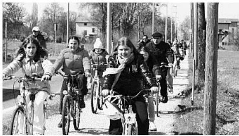
I bambini sulla nuova ciclabile